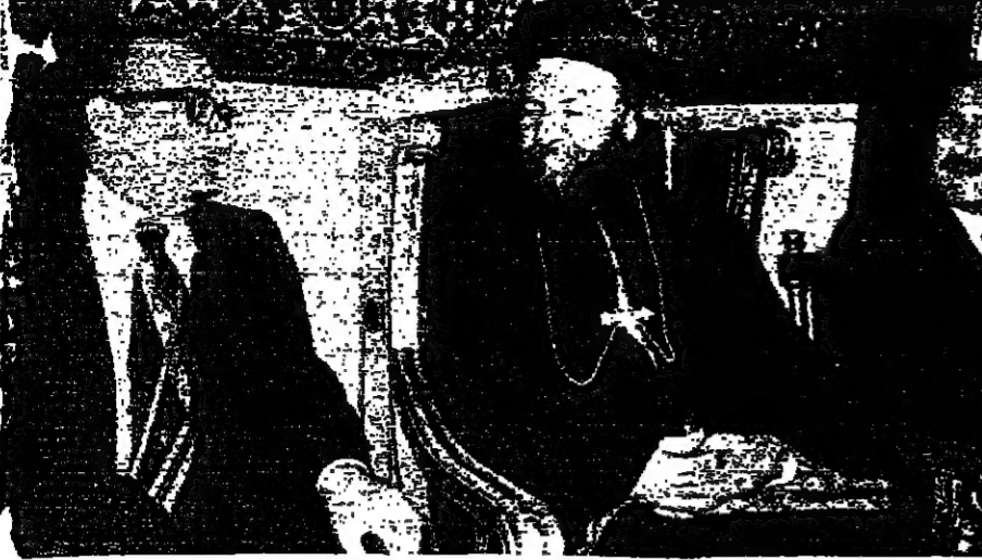
وجع سيدة المطران اشانوس اسرام

استمرار المباحث بين الملك خالد والملك حسين